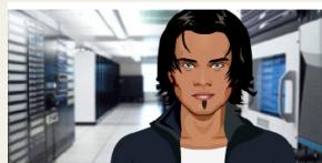
Aladin de webassistent