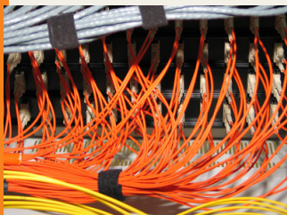
Samenwerking netwerk belangrijk